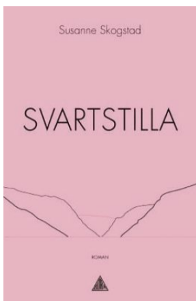
Svartstilla Susanne Skogstad Gloria forlag