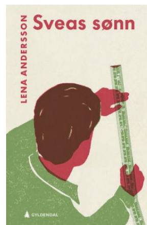
Sveas sønn Lena Andersson Oversatt av Bodil Engen Gyldendal